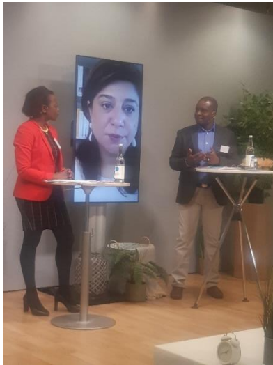
Zwei Vorstandsmitglieder von A.D.A.G.E. in einer Paneldiskussion mit einer Vertreterin des Stabs der Beauftragte der Bundesregierung für Migration, Flüchtlinge und Integration anlässlich des Diaspora Summits, Berlin, 18. März 2022.