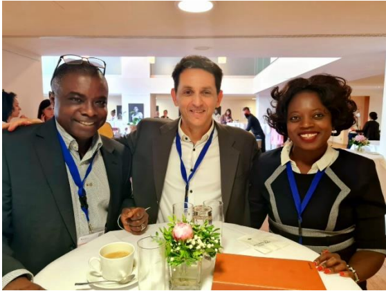
Drei Vorstandsmitglieder von A.D.A.G.E. anlässlich der Konsultationen zur neuen Afrikastrategie des BMZ, Berlin, 4. Juli 2022.