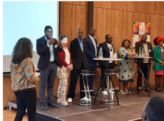
Paneldiskussion anlässlich des Afrika Forums Baden-Württemberg, links das dreiköpfige Team von GAI e. V., Stuttgart, 27. Oktober 2022.

Im Rahmen der Landeskonferenz des Rats für Entwicklungszusammenarbeit am 17.09.21 leitete GAI e. V., in Zusammenarbeit mit A.D.A.G.E., den Workshop "Die deutsch-afrikanische Zivilgesellschaft gestaltet die Zukunft mit". Beide Organisationen wirkten an der konzeptionellen Vorbereitung und Umsetzung des "Baden-Württembergischen Afrika Forum", das am 27. Oktober 2022 in Stuttgart stattfand, mit. Vorstandsmitglieder von A.D.A.G.E. hielten Vorträge, nahmen als Panellisten an Fachdiskussionen teil und leiteten Workshops.