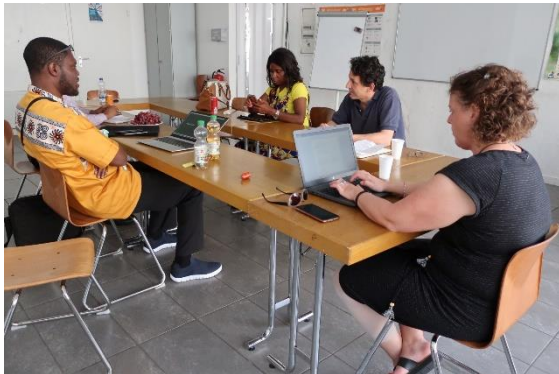
Workshop zur Strategieentwicklung von A.D.A.G.E., Köln, 18. Juni 2022.

Transnational Corridors e. V. (Berlin) einen Workshop zur Strategieentwicklung von A.D.A.G.E. Dieser Workshop fand im Rahmen des von der DSEE geförderten Vorhabens "Digit-Ready. Ideen und Ansätze zur Organisationsentwicklung zur Stärkung der transnationalen Netzwerke im Ehrenamt" statt.