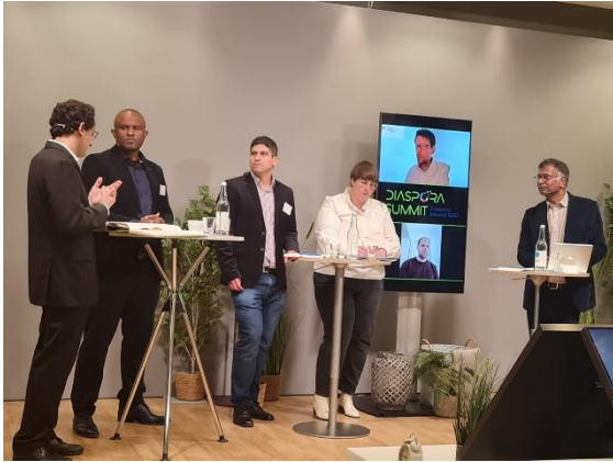
Der Vorstandsvorsitzender von A.D.A.G.E. (links) in einer Paneldiskussion mit Vertretern der Zivilgesellschaft und des BMZ während des Diaspora Summits, Berlin, 18. März 2022.