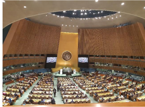
Die Regierungen der Welt tragen während des International Migration Review Forums ihre Fortschrittsberichte vor, New York, 17. Mai 2022.

informelle Gespräche mit Vertretern der deutschen Regierungsdelegation statt, unter anderem in der deutschen Botschaft. Es fanden auch Austausche mit den anderen Vertretern der deutschen Zivilgesellschaft, darunter der Robert Bosch Stiftung, der Friedrich-Ebert-Stiftung, dem Verband der Entwicklungspolitischen Nichtregierungsorganisationen (VENRO), sowie mit Forschungseinrichtungen wie dem Deutschen Zentralinstitut für Integration und Migration (DeZIM) und der Stiftung Wissenschaft und Politik (SWP).