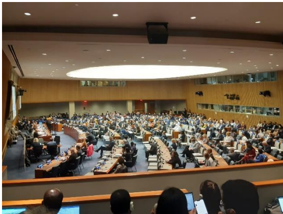
Multi-Stakeholder Hearing im Gebäude der Vereinten Nationen, New York, 16. Mai 2022.

Kontakte wurden geknüpft zur Afrikanischen Union und zur Africa-Europe Diaspora Development Platform (ADEPT), einer Dachorganisation der afrikanisch-europäischen Zivilgesellschaft in Brüssel. Die Friedrich-Ebert-Stiftung veröffentlichte ein Interview des Vorstandsvorsitzenden von A.D.A.G.E. über das IRMF.