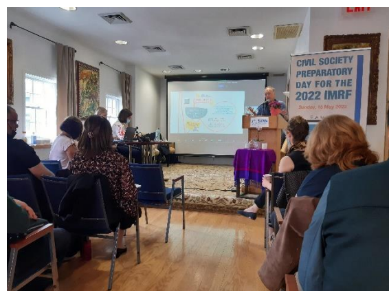
Workshop des Civil Society Action Committee zur Vorbereitung des IMRF, New York, 15. Mai 2022.

Da A.D.A.G.E. im Januar 2022 noch nicht eingetragen war, wurde das Mitglied Transnational Corridors von den Vereinten Nationen für das IMRF akkreditiert. Am 15. Mai 2022 nahm der Verein an einem Vorbereitungsworkshop in New York auf Einladung des Civil Society Action Committee teil.