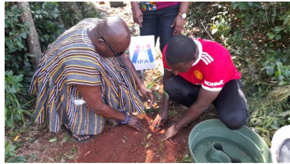
Die Bäume von Transnational Corridors/Berlin, Giving Africa a new Face/München und International Friendship Association/Frankfurt.